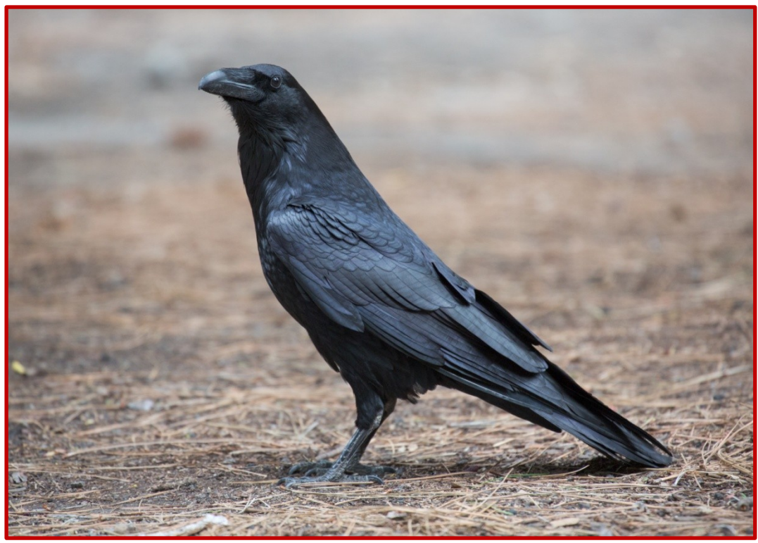
Κόρακας ( Corvus corax )