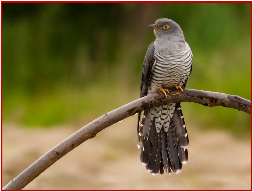
Κούκος ( Cuculus canorus )