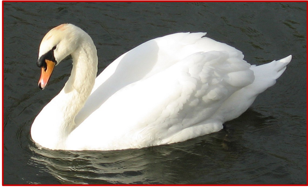
Κύκνος ( Cygnus olor )