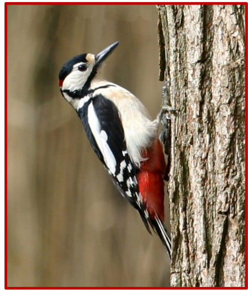
Πευκοδρυοκολάπτης ( Dendrocopos major )