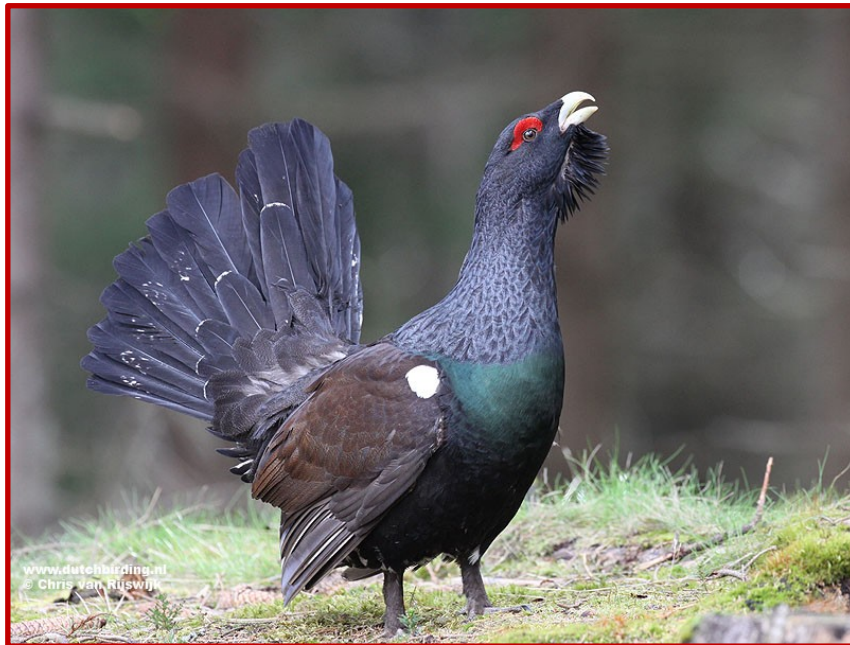
Αγριόκουρκος ( Tetrao urogallus )