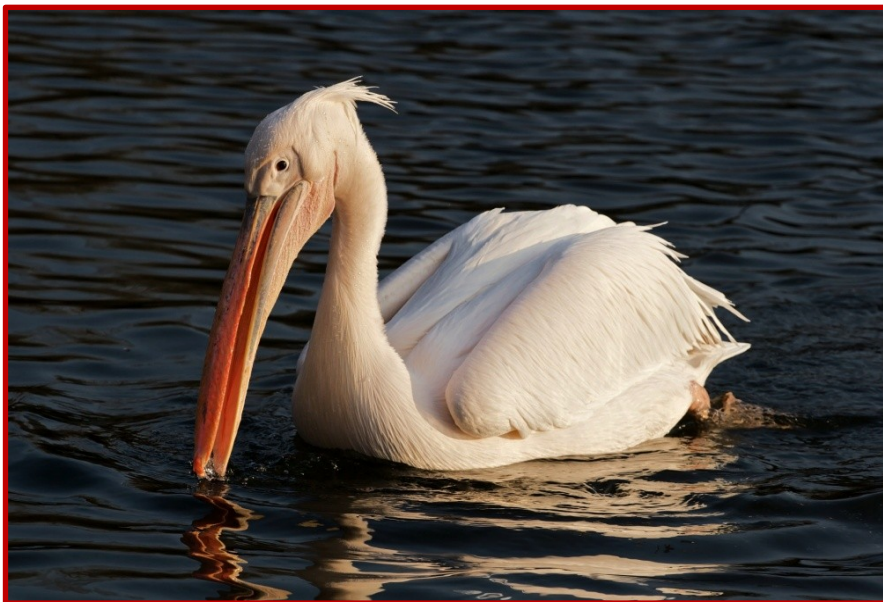
Ροδοπελεκάνος ( Pelecanus onochrotalus )