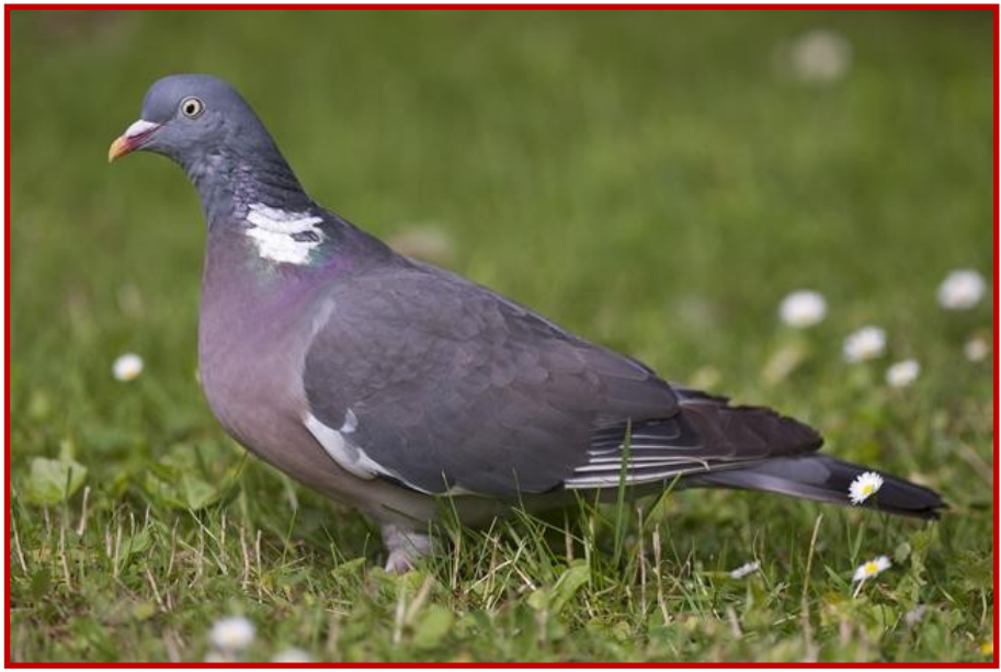
Φάσσα ( Columba palumbus )