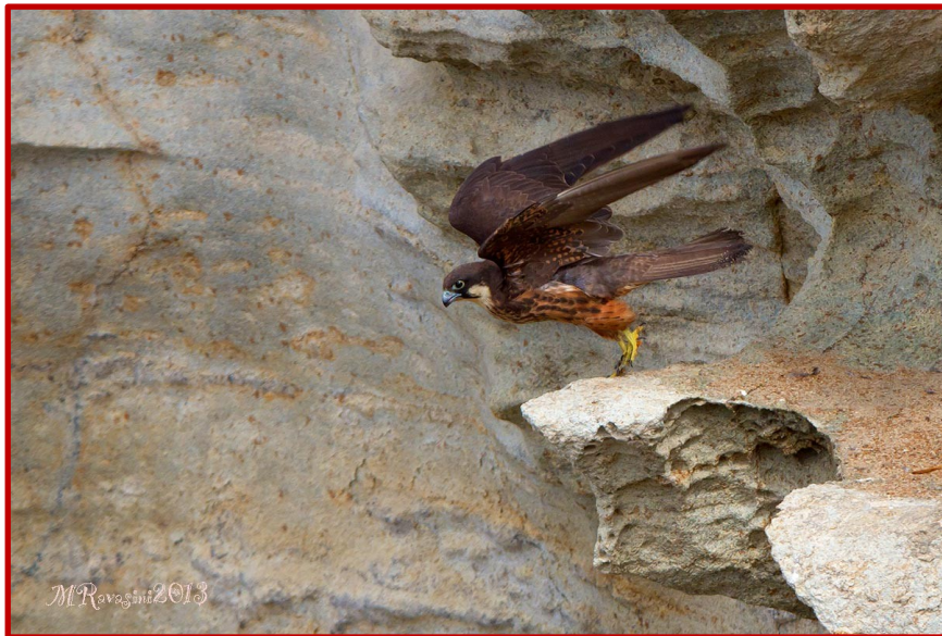
Μαυροπετρίτης ( Falco eleonora )