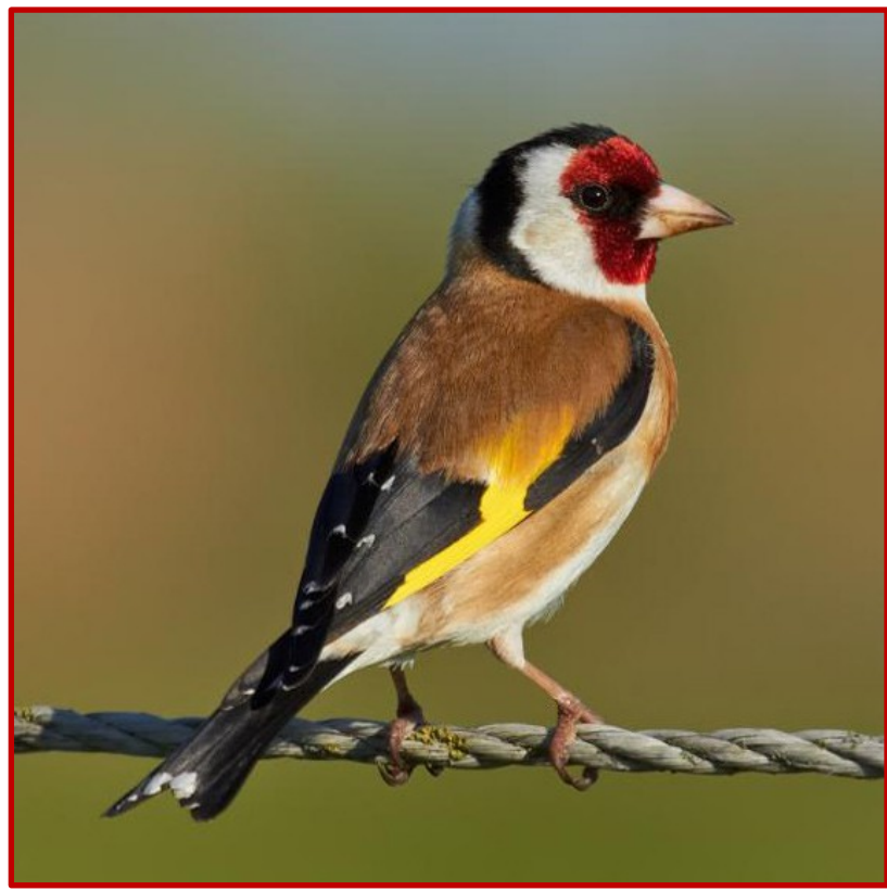
Καρδερίνα ( Carduelis carduelis )