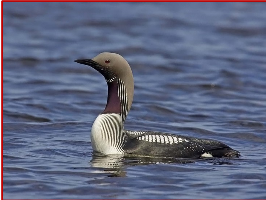
Λαμπροπούτι ( Gavia arctica )