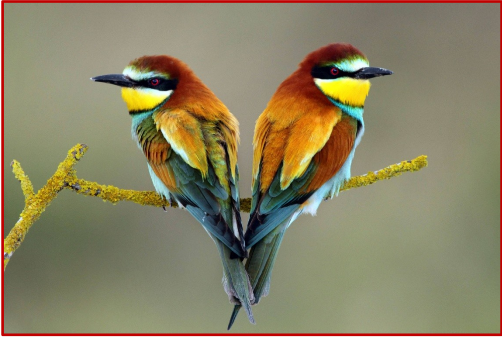
Μελισσοφάγος ( Merops apiaster )