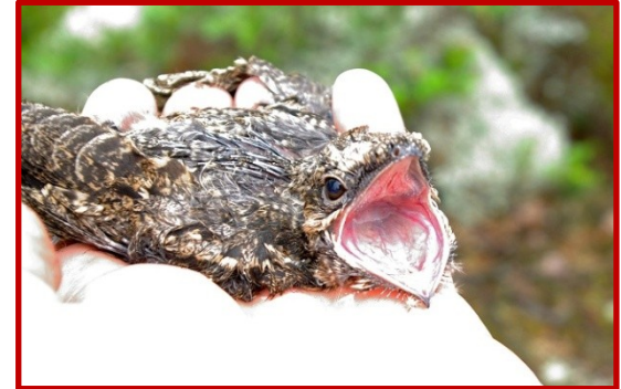
Γιδοβύζι ( Caprimulgus europaeus )