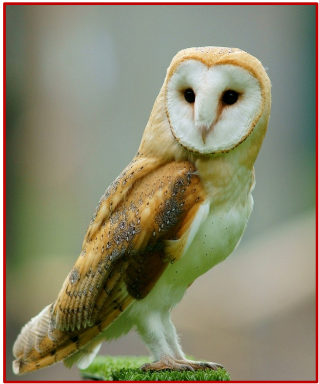
Τυτώ ( Tyto alba )