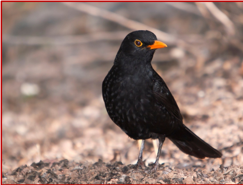
Κότσυφας ( Turdus merula )