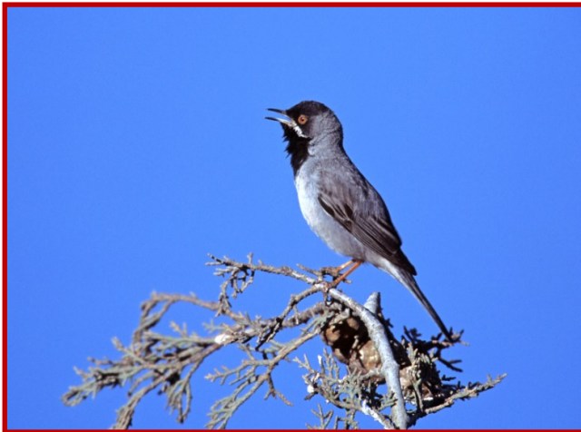
Αιγαιοτσιροβάκος ( Sylvia ruepellii )