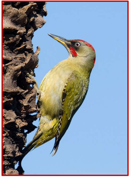
Πράσινος δρυοκολάπτης ( Picus viridis )