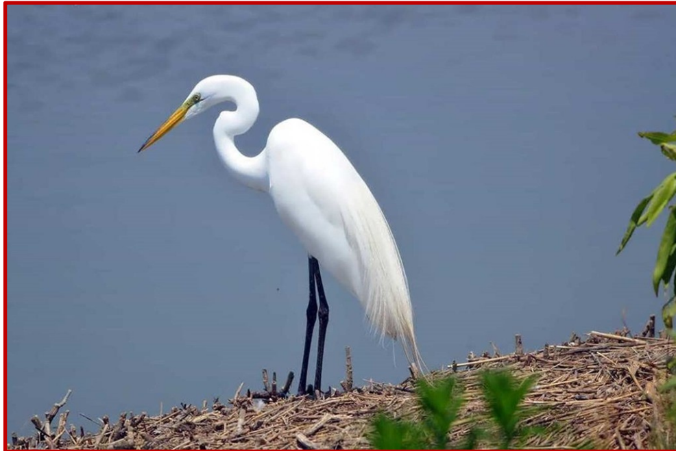
Αργυροτσικνιάς ( Egretta alba )