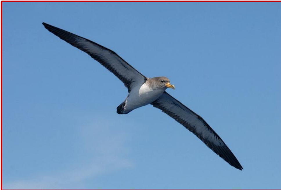
Αρτέμης ( Calonectris diomedea )