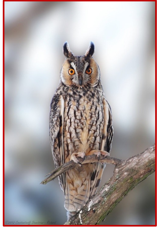
Νανόμπουφος ( Asio otus )