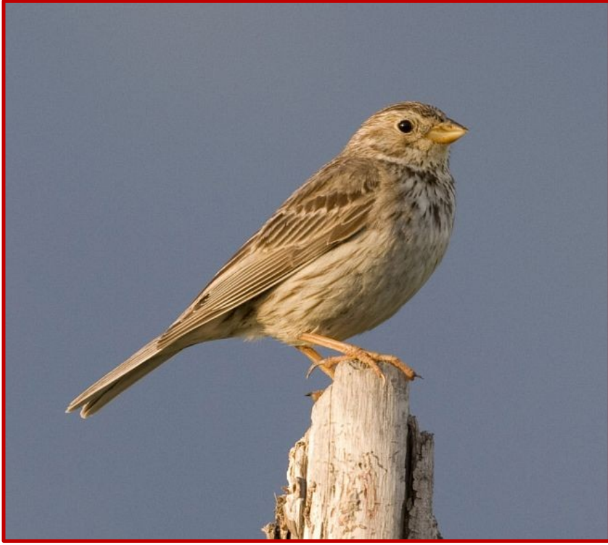
Τσιφτάς ( Miliaria calandra )