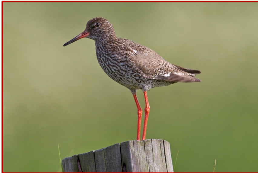
Κοκκινοσκέλης ( Tringa totanus )